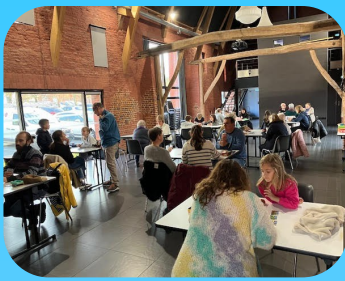
Après-midi jeux de société