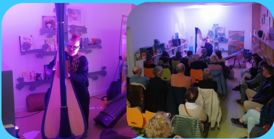
Live entre les livres à la bibliothèque