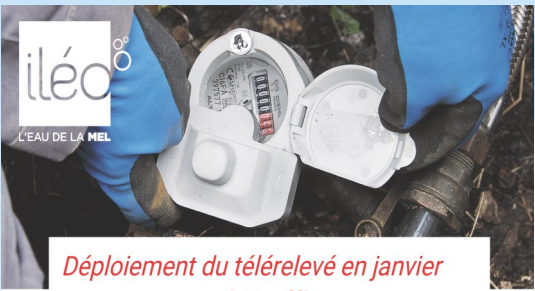
Déploiement du télérélevé en janvier à Toufflers

Pour une meilleure gestion de la ressource en eau de ses abonnés et pour simplifier le relevé de votre compteur d'eau, la Métropole Européenne de Lille, via iléo, met en place le télérélevé.