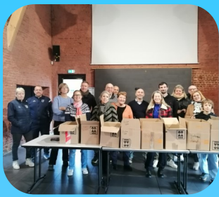
Récolte pour la banque alimentaire

La commémoration du 107 e anniversaire de l'Armistice s'est déroulée le mardi 11 novembre 2025. Elle a débuté devant le monument à la Mémoire de la Reine Astrid de Belgique, puis s'est poursuivie au cimetière de Toufflers, devant le monument aux morts, ainsi que devant les tombes des soldats anglais et celle du douanier Martinache.