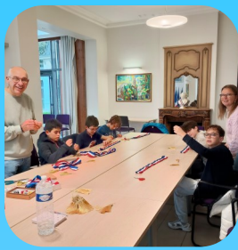
Confection des écharpes du conseil municipal des jeunes