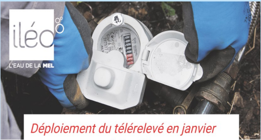
Déploiement du télérelevé en janvier à Toufflers

Pour une meilleure gestion de la ressource en eau de ses abonnés et pour simplifier le relevé de votre compteur d'eau, la Métropole Européenne de Lille, via iléo, met en place le télérelevé.