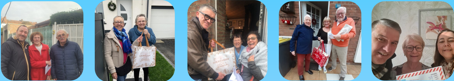
Distribution des colis aux aînés