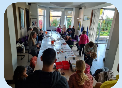
Séance maquillage pour Halloween