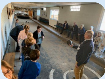
Semaine bleue à la Bourle du Cercle St Paul