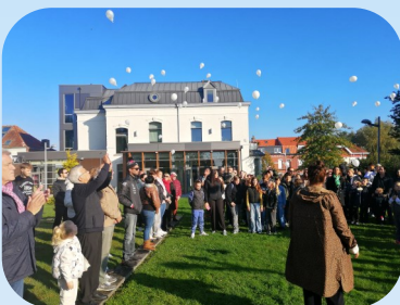
Homage à Nahel