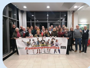
Animation contre les violences faites aux femmes