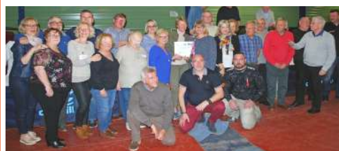
La gagnante du super loto a remporté un bon pour un voyage d'une valeur de 1600€

L'association TOUFLERS en FÊTE vous donne RDV pour 2020.