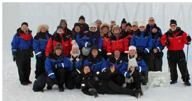
"LES AURINKO" (groupe 1 et 2)